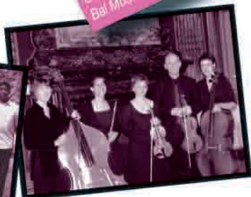
Les Salons Parisiens Carnet de Bals, danse Bal Mus Art, musique

Tarifs : 18 € adhérents - 15 € Enfants : 9 €